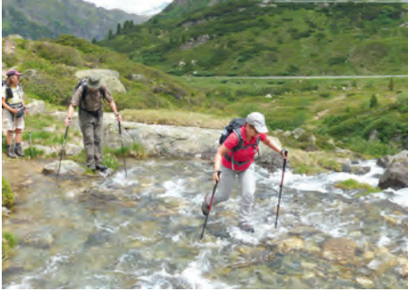
Gefährliche Bachquerung

Es war an einem Dienstag. Jadranka hatte eine Tour ausgearbeitet, die von Gortipohl hinauf zu einigen Mauseßsiedlungen ging, das sind alte Walsershäuser, zu denen das Vieh im Mai hochgetrieben wurde, um im Juli von dort auf die Hochalmen gebracht zu werden. Diese Häuser sind hergerichtet und als Ferienunterkünfte heute sehr beliebt. Über 750 Höhenmeter waren zu bewältigen, der Abstieg war dementsprechend sehr steil!