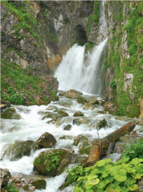
Wasserfälle aus dem Dachsteinmassiv

Gegen Mittag wurde es trocken und je näher wir uns Abtenau näherten desto offener wurde der Himmel. Wir erreichten das sehr schön gelegene Abtenau bei fast strahlendem Sonnenschein, was den Regen des Tages wieder vergessen ließ.