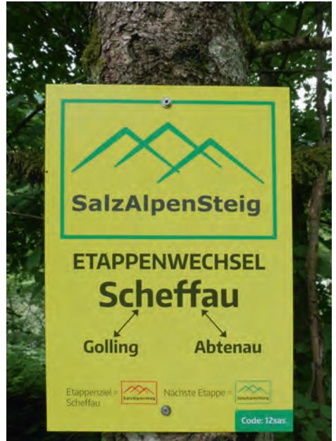
Das Wanderzeichen, unser ständiger Begleiter

diesen ersten Wandertages setzte Regen ein. Und der Regen sollte auch an den nächsten Tagen unser, fasst, ständiger Begleiter sein. Der weitere Weg an diesem ersten Tage war wenig erlebnisreich und wir erreichten die Pension in Scheffau am frühen Nachmittag.