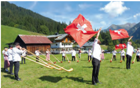
Alphornbläser in Baad

Am nächsten Tag, einem Sonntag, gab es ein Alphornfestival in Baad, dem letzten Ort im Kleinwalsertal. Da wir nicht nur sitzen, hören und essen wollten, fuhr die ganze Gruppe mit dem Bus bis Hirschegg und dem Heuberglift zum oberen Höhenweg. Wir folgten dem bequemen Wanderweg mit herrlichem Weitblick und stiegen dann nach Baad ab. Verschiedene Alphorngruppen aus der Schweiz, aus Österreich und Deutschland trugen ihre Musikstücke vor. Bei leckeren Speisen und Getränken verging die Zeit schnell. Den Rückweg konnten alle individuell gestalten, mit dem Bus oder noch ein Stück zu Fuß an der Breitach entlang.