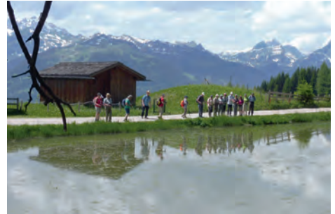
Am Geologischen Höhenweg

ten Blumenwiesen vorbei, immer mit Blick hinüber in den Rätikon und zur Zimba. Der Berggasthof Rellseck bot uns willkommene Einkehr.