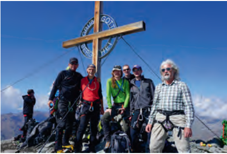
Gipfelfoto Weißseespitze mit einem Gruppenfoto unterstützt.

Die Sichtverhältnisse waren hervorragend und im Süden konnte sogar der Reschensee erkannt werden. Nach dem Genuss unserer Brote und Eberhards Äpfeln konnten wir uns gutgelaunt auf den Rückweg begeben, der dann allerdings wegen der mittlerweile deutlichen Plusgrade anstrengender war, aber ohne Zwischenfälle verlief. Über die gesamte Woche war der Dienstag dann auch der Tag mit den besten Wetterverhältnissen.