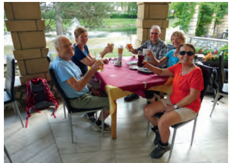
Ende der Wanderwoche

Stetig ging es von dort bergab durch dichte Waldgebiete über schattige Wege direkt nach Bleiburg hinunter, wo wir wieder in einer schönen JUFA nächtigten.