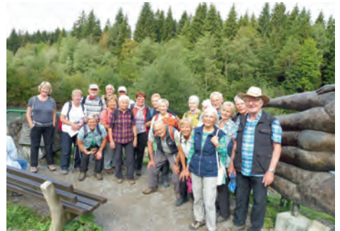
Am Illerursprung

Am letzten Tag wanderten wir alle an der Trettach entlang zum Illerursprung. Hier fließen Breitach, Stillach und Trettach zusammen. Ab dann heißt der Fluss Iller. Über Rubi erreichten wir wieder Oberstdorf, nicht ohne vorher noch eine erquickliche Rast auf einem Hof mit Buttermilch, Schmalzbröten, Kuchen und dergleichen mehr eingelegt zu haben.